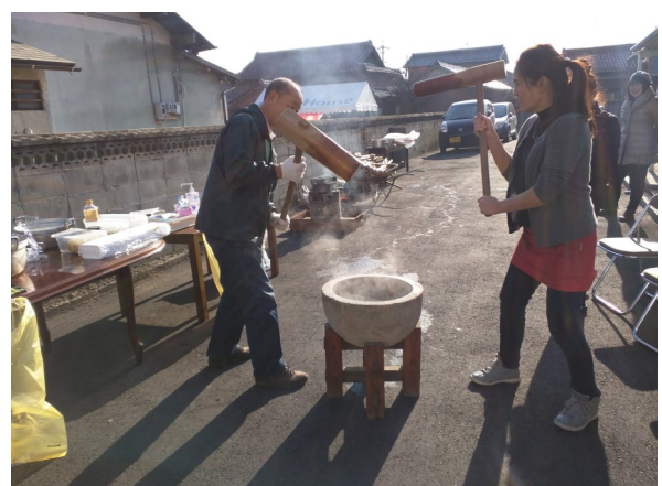
年末に実施した餅つき