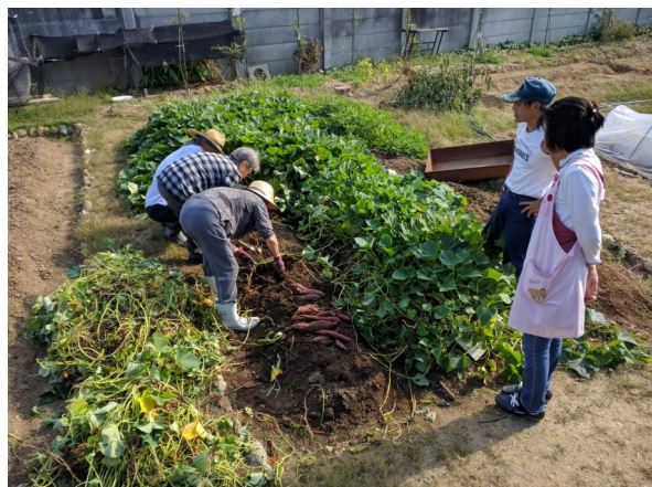
ボランティアさんと芋掘り

家族介護者支援の延長として、利用者、家族が安心して利用できる介護保険サービスが必要ではないかとの思いから、29年の1月にデイサービスを開所しました。