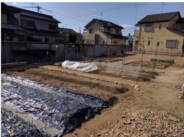
1月、春に向けて整備する