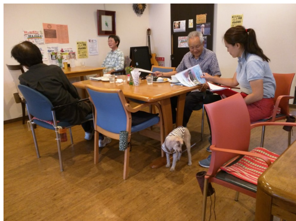
モーニングを食べながら相談

開館日数 289日 来所者数 12,812名 月平均1,068名 相談件数 509件 月平均42件 運営体制 常勤2名、非常勤1名 ボランティア15名 備考 春日井市補助事業 かすがいオレンジぱらすカフェ (認知症カフェ)