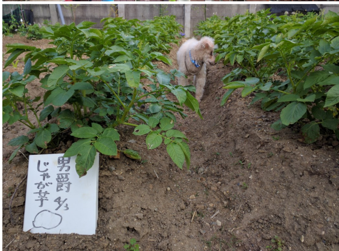
上左：家族介護者支援センターてとりんハウス 上右：デイサービスてとりん村 下2枚：ケアラール&コミュニティ農園