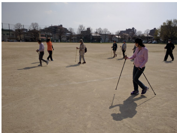
ポールウォーキング講座