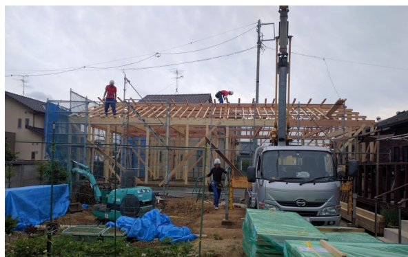
てとりん村拡張工事中

今年度は、規模の拡大に伴う経営のあり方や、体制の整備が課題ですが、さらにもう一度初心にかえって、家族介護者を支援するNPOとしてのあり方を見直し、今後の活動につなげていきたいと思えます。