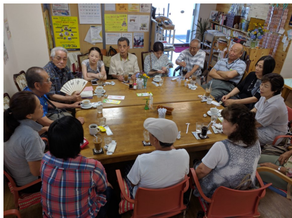
家族介護者のつどい