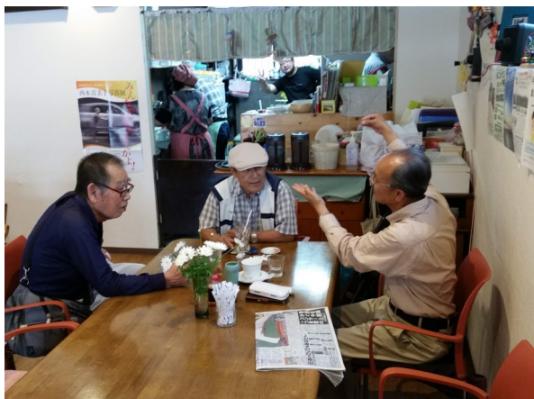
介護者同士で盛り上がる

開館日数 289日 来所者数 12,812名 月平均1,068名 相談件数 509件 月平均42件 運営体制 常勤2名、非常勤1名 ボランティア15名 備考 春日井市補助事業 かすがいオレンジぱらすカフェ (認知症カフェ)