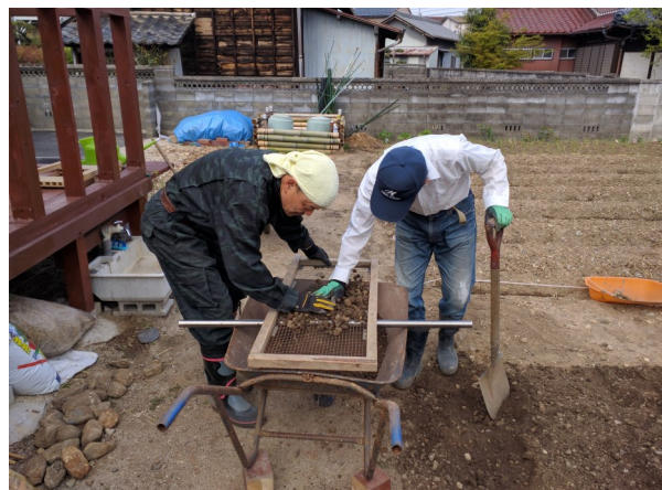
土をふるいにかけて小石を取り除く