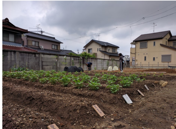
じゃがいもの栽培（4月）