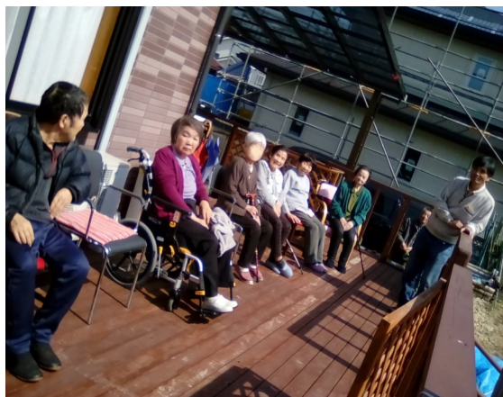
ウッドデッキで日浴中