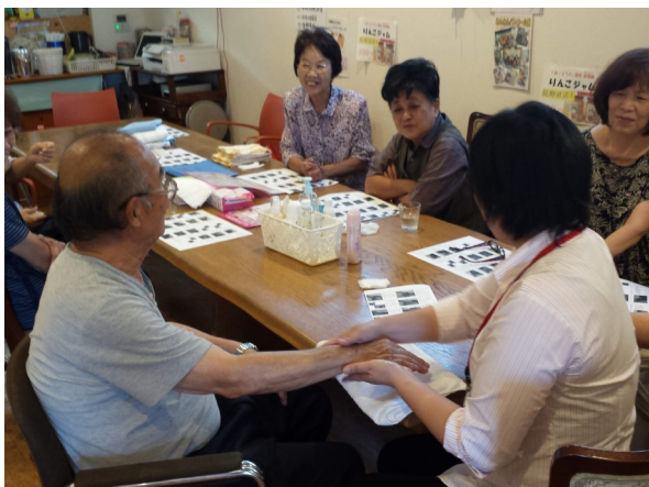
介護者のハンドタッチ講座